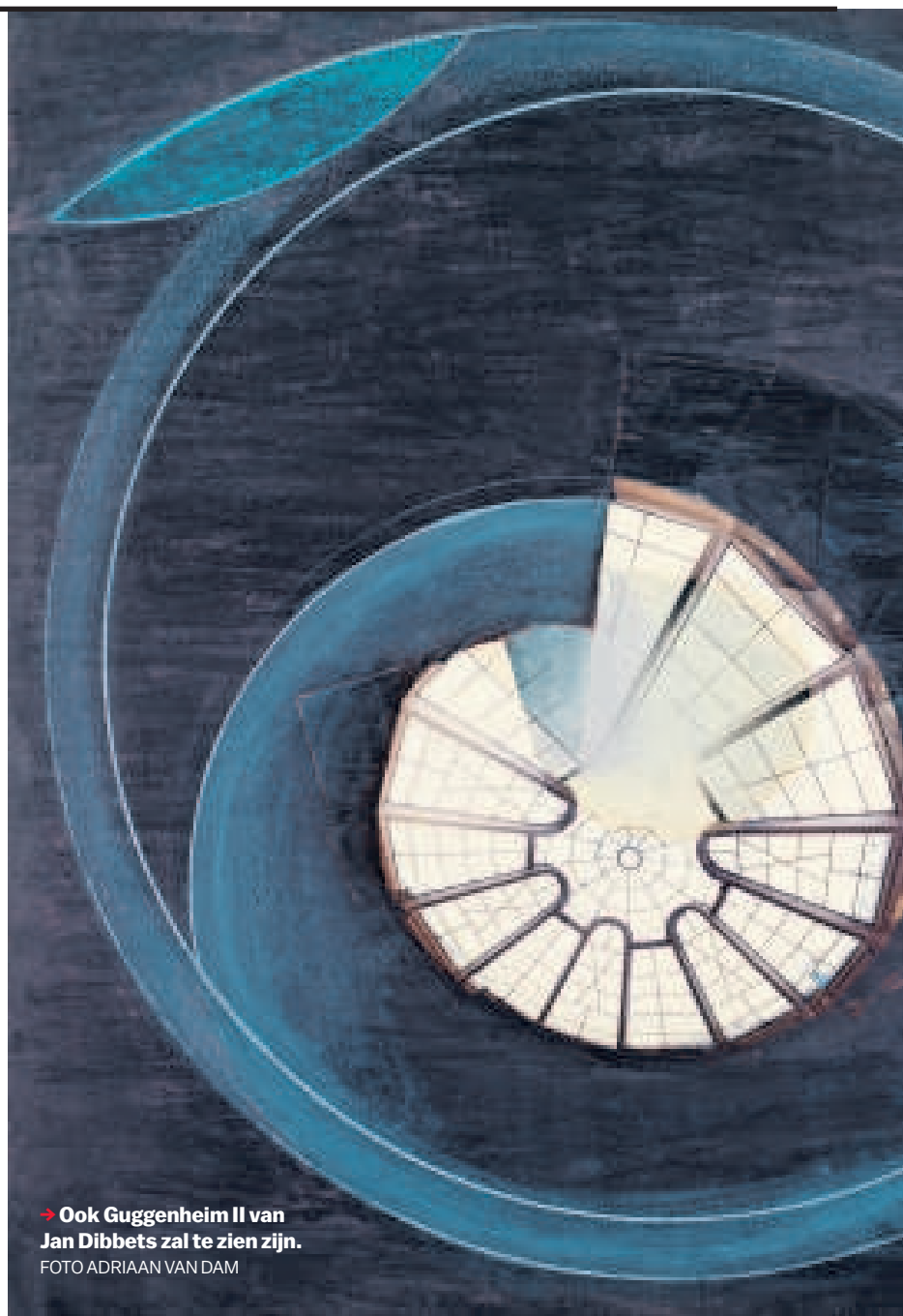
→ Ook Guggenheim II van Jan Dibbets zal te zien zijn.

Waar vroeger jongens van 10 tot 14 jaar sliepen, is nu de boardroom